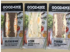
Triângulos Snock - Pasta Frango, Pasta Atum, Pasta Delicias do Mar