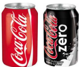
Coca Cola e Coca Cola Zero