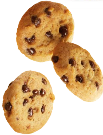
Bolachas Pacote e artesanais