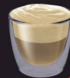
Galão Lote Platina