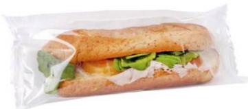
Sandes Flowpack - Baguete integral, Pão Sementes ou Pão girassol com Fiambre de peru