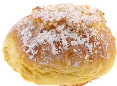
Pão de Deus