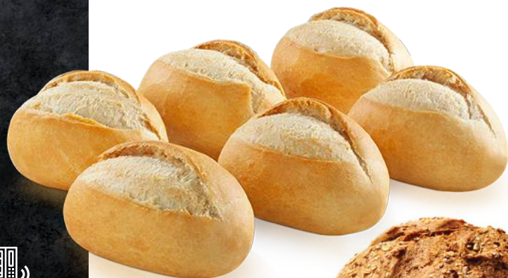
Sandes Pão Bola e Pão Baguete