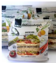
Rectângulos Snock - Peru, Frango, Americana e Atum