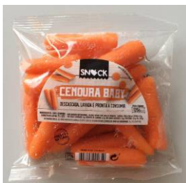
Cenouras Baby 125gr.