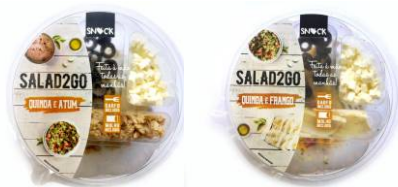
Saladas 2 GO - Quinoa & Frango, Quinoa e Atum Salada com ingredientes, garfo e molho vinagrete