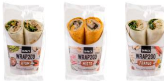
Wraps - Frango, atum e Vegetariano