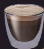
Leite com Chocolate