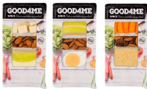
Pack Proteínas - Cenoura & Humus, Maça e Ovo, Maça & Queijo Gouda ( Todas as variedades têm frutos secos e passas )