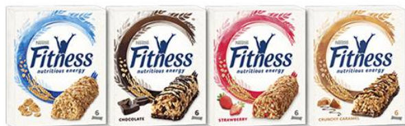
Barras Cereais Nestle Fitness