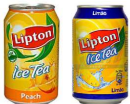
Lipton Ice Tea