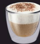
Cappuccino Lote Platina