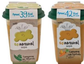
Sopas sem batata - Cenoura & Açafrão, Courgette e Manjeriço