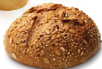
Sandes Pão cereais e Pão Girassol