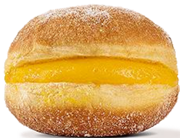
Bolos de Pastelaria