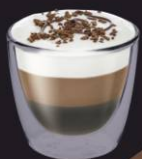
Mocaccino Café Platina