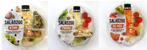
Saladas 2 GO - Frango, Salmão e Atum Salada com ingredientes, garfo e molho vinagrete