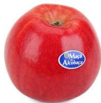
Peça Fruta Embalada