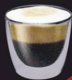
Café Pingado Lote Platina