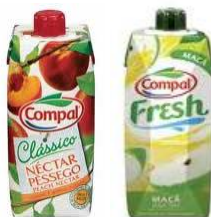
Sumo Compal Clássico e Fresh